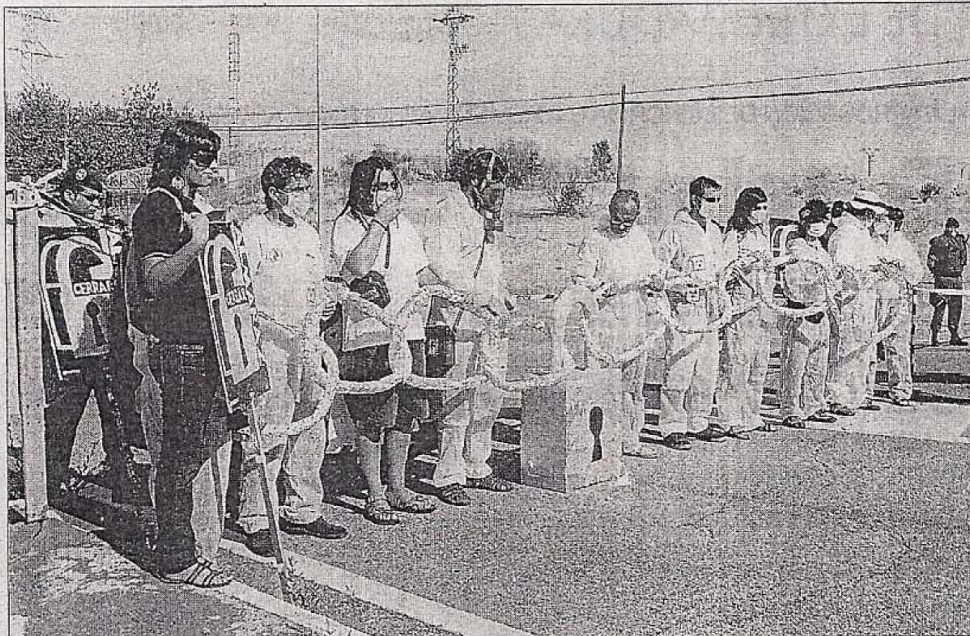
►► Protesta ► Los manifestantes, concentrados frente a la central portando cadenas de papel.

Finalmente, una manifestación recorrió varias calles de la capital del Campo Arañuelo recordando su sempiterna petición: "Cerrar Almaraz y todas las demás". Aunque ahora -ya con cerca de 200 personas participando (algunas llegadas desde Portugal)- aumentaron los cánticos: "Fernández Vara, ¿quién eres tú para comerciar con nuestra salud?" o "Extremadura no quiere más basura", se pudo oír. Eran las siete de la tarde y el sol había desaparecido para dejar paso a los nubarrones y la lluvia, que habían sido anunciados.