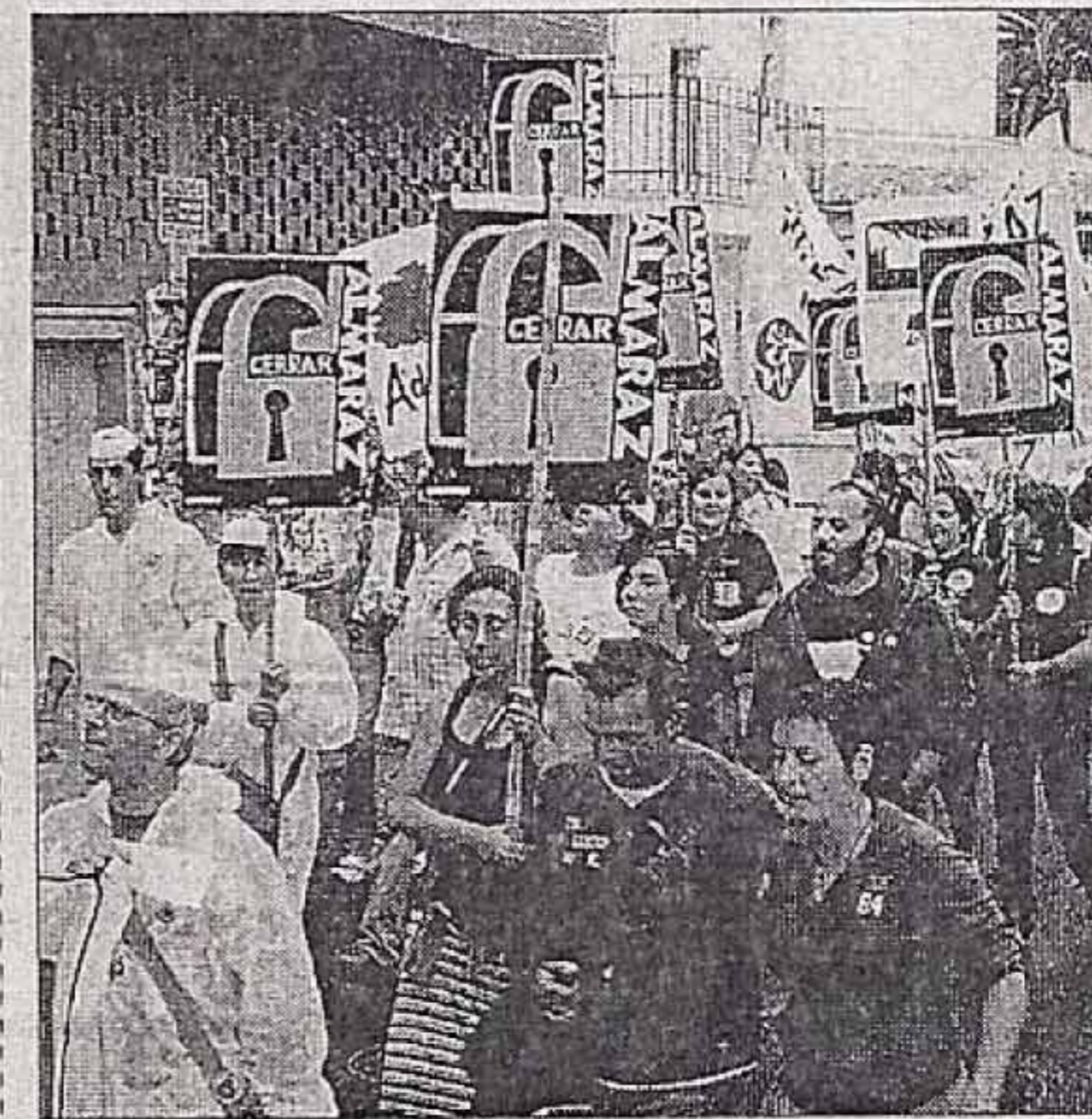
►► Protesta ► Manifestantes recorren Navalmoral.