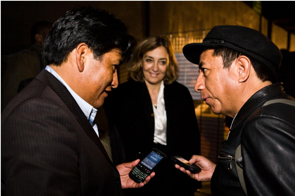
El encuentro no esperado de Quispe y Olivera en el FAMA.. J. Marcos