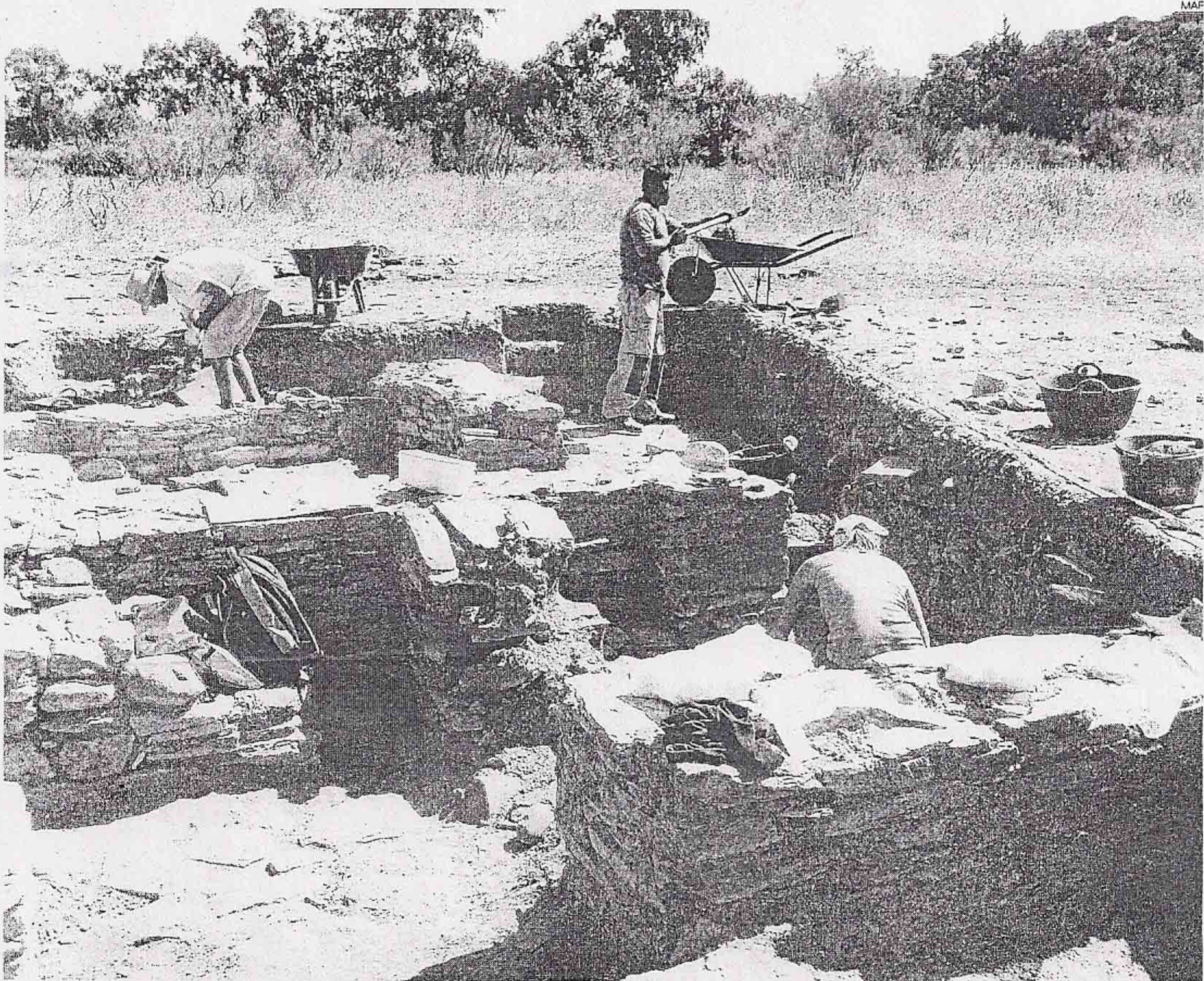
►► Imagen del estado de las excavaciones el pasado viernes.

La segunda campaña de excavaciones en la ciudad musulmana de la localidad enclavada en la provincia de Cáceres muestra nuevos datos de la forma de vida en el Medioevo. Se ha descubierto una nueva vivienda y ya se ven calles y aceras