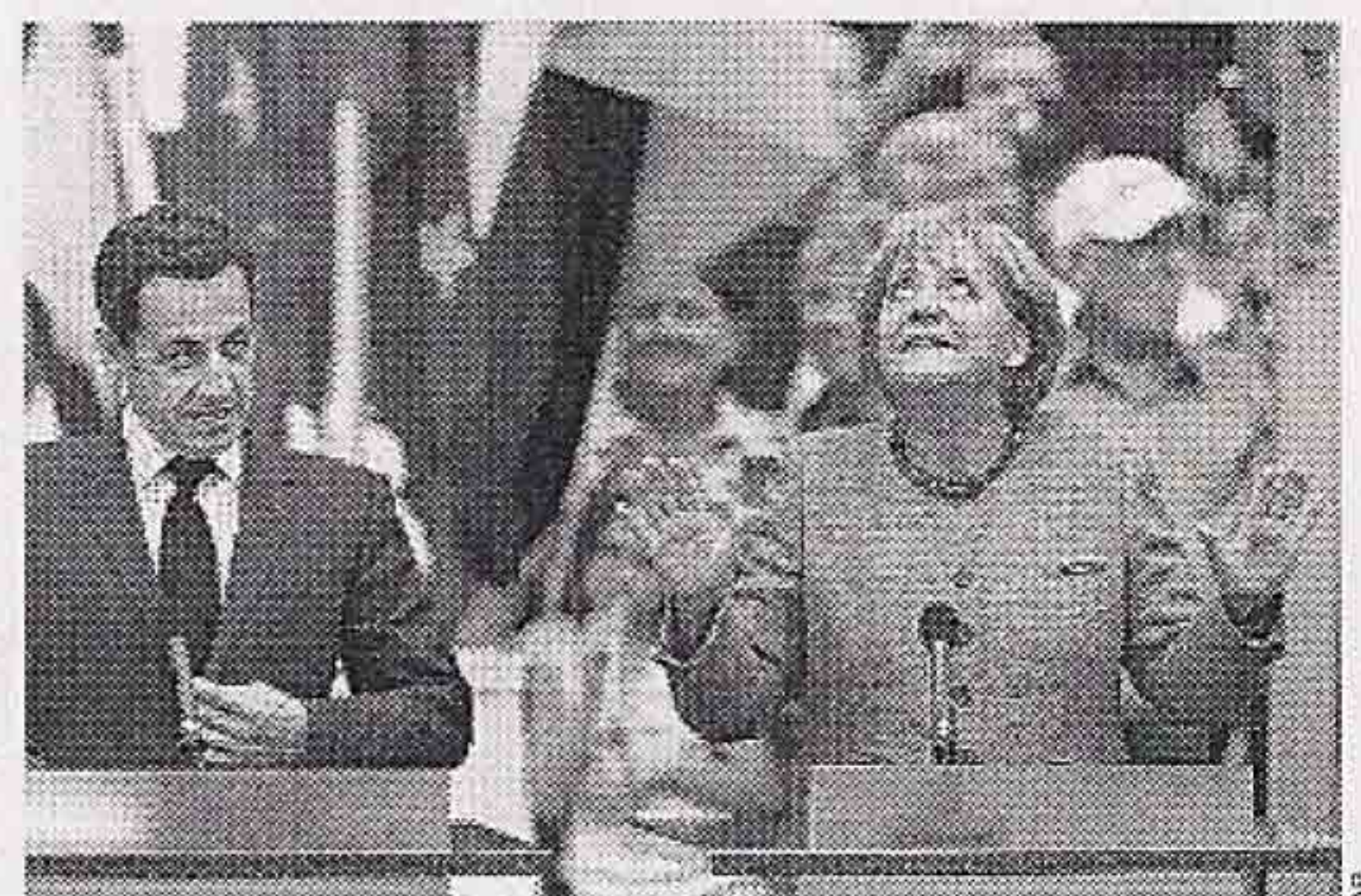
> La Canciller alemana, Angela Merkel, y el Presidente francés, Nicolas Sarkozy, gesticulan ante la amenaza de lluvia ayer en Straubing, Alemania.

Por otro lado, en Tokio, el Gobierno de Japón también tuvo ayer