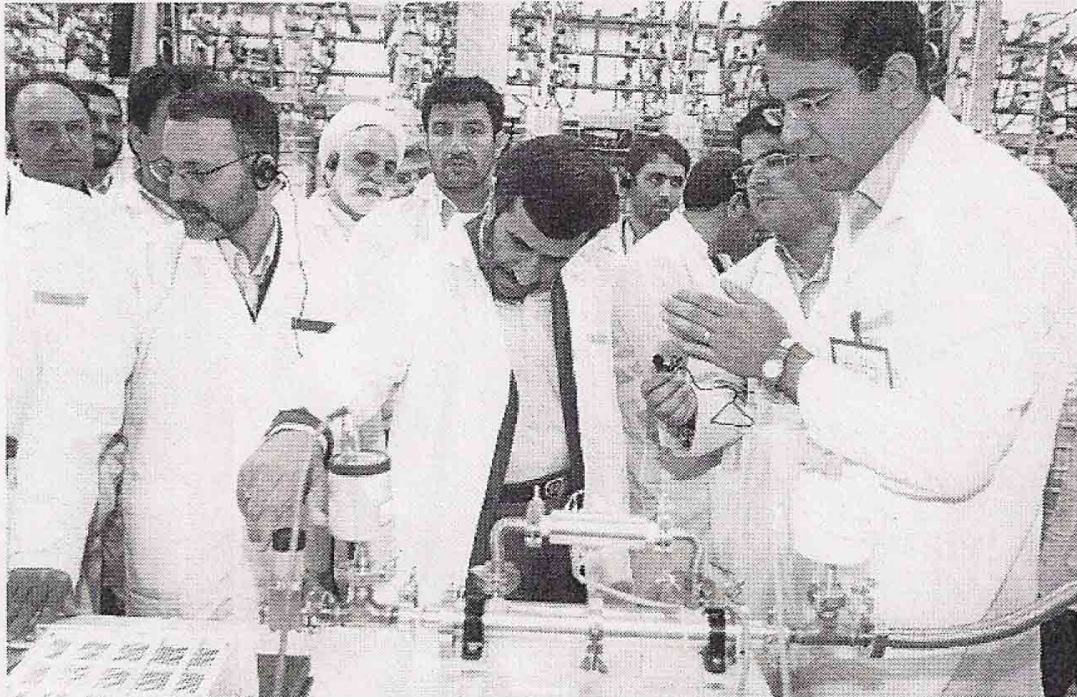
NOVEDADES ATÓMICAS. El Presidente de Irán, Mahmoud Ahmadineyad (centro), durante una visita, en abril, a la planta nuclear de Natanz.

Los objetivos estratégicos históricos de los estadounidenses en el Medio Oriente están relacionados con el petróleo e Israel. Con estas cartas sobre la mesa, Irán también quiere jugar: es un gran productor mundial de crudo y es enemigo total de Israel. Otro naipes más para la partida: